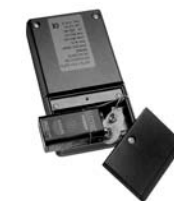
DK Billede 1: Udskiftning af batteri (5905A).

DE Diese Installationsanleitung für Techniker umfasst die folgenden Produkte: 5905A & 5909